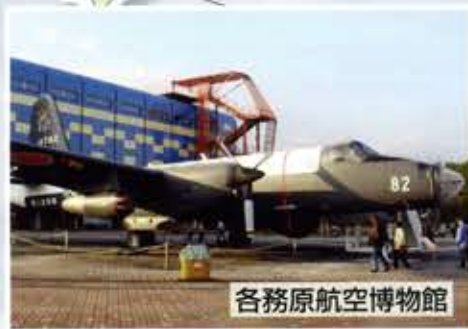
各務原航空博物館

第67回全国国公立幼稚園・こども園長会 総会・研究大会 第25回東海北陸国公立幼稚園・こども園長会 研究大会