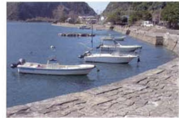
6 世界遺産 三角西港