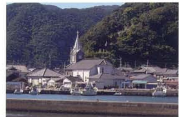
9 世界遺産 崎津集落