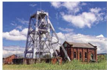
1 世界遺産 万田坑