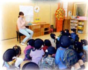
指導力を高める研究保育

国が示す幼児教育の指針に基づいた教育が、全国の国公立幼稚園・こども園で実践・推進されるよう、関係諸機関と連携・協力の下、園経営の充実と教員・保育士の育成を重要施策として取り組んでいます。