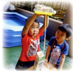
水が上がったり下がったり ポンプみたい

具体的な体験を通して人と関わる力や思考力、表現力などを育むため、豊かな環境づくりと個に応じた援助の両面から、指導内容・方法等の工夫や充実に努めます。