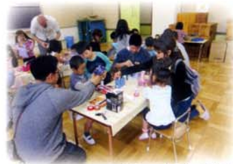
親子で一緒に動く車作り

保護者が安心して子育てができるよう、親と子が共に育つ場の提供や情報交換の機会をつくる等、地域の幼児教育センター的な役割を果たしていきます。