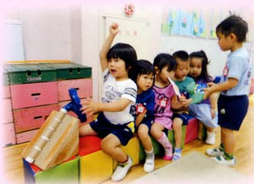
積木を並べて 出発進行!積木を並べて 出発進行!

遊びを通した総合的な指導を充実させ、将来の学びの基礎となる心情・意欲・態度や、自分で考え判断し、行動する力を身に付けます。