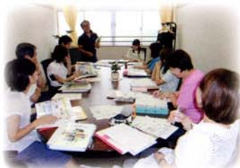
保育所や小学校と連携しての合同研修会

教員・保育士が主体的に学び、高め合う集団となるよう、研修・研究等の工夫・充実を図り、専門性と指導力の向上を目指します。